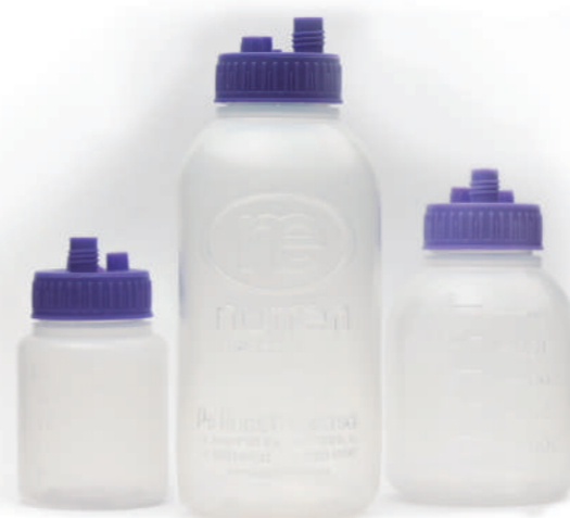
FRASCO NUTRICIÓN ENTERAL 650cc apto pasteurización